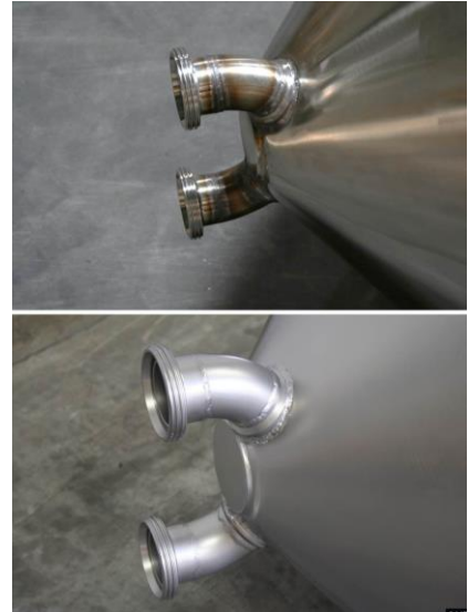
Voor en na