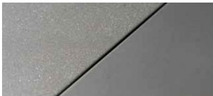
Rechts: behandeld met het waterstraal proces Links: behandeld met conventioneel parestralen

Hoewel waterstralen belangrijke kenmerken deelt met het reguliere beitsen, zoals het verwijderen van lasverkleuringen en herstellen van de chromoxidehuid, is het geen vervanging voor het reguliere beitsen. Het waterstralen is ontwikkeld om een oplossing te bieden indien er zeer specifieke eisen worden gesteld betreffende de afwerkingsgraad van materialen of constructies. Het beoogde resultaat kan enkel worden bereikt wanneer de te behandelen materialen zo perfect mogelijk zijn afgewerkt en gereinigd. Reeds tijdens het productieproces dient hier de nodige aandacht aan te worden besteed. Materiaalkeuze, ontwerp, bewerkingstechnieken en gebruikte